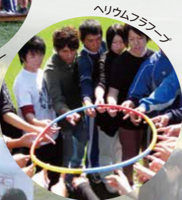
ヘリウムフラフーフ