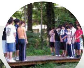
ジャイアントシーソー